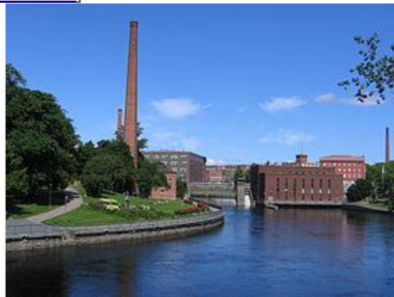
Tampereella sijaitsevan Tammerkosken rannat ovat Suomen vanhimpiin kuuluvaa teollisuusmiljöötä.

Modernisoituva Suomi [muokkaa | muokkaa wikitekstiä ]