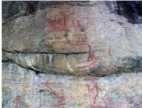
Astuvansalmen kalliomaalaukset Ristiinassa Etelä-

Suomen esihistoria käsittää pääasiassa jääkauden jälkeisen ajan Suomen asuttamisesta aina historiallisen ajan alkuun asti. Pohjoismaissa esihistoria jaetaan yleensä kivikauteen, pronssikauteen ja rautakauteen, joka on myös Suomen esihistoriassa käytetty jaottelu. Jaottelu on peräisin arkeologisen tutkimuksen alkua ajoilta, jolloin löytöesineet jaoteltiin kiven, pronssin ja raudan perusteella ryhmiin. Nykyinen arkeologinen tutkimus nojaa luokittelussaan moniin luonnontieteellisiin ajoitusmenetelmiin ja ajoituksen nimistöä on monipuolistettu.