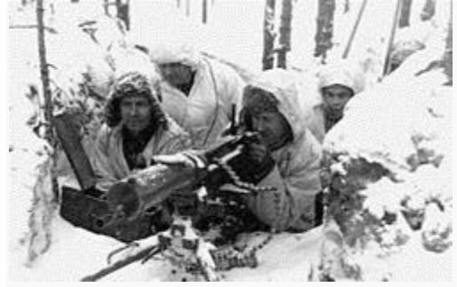
Suomalaisia sotilaita talvisodassa.

Vuonna 1938 Neuvostoliitto esitti ensimmäisen kerran epävirallisesti alueluovutuksia Karjalan kannaksella . Suomi kieltäytyi ehdottomasti. Seuraavan vuoden syksyllä, kun toinen maailmansota oli alkanut, Neuvostoliitto vaati Suomelta tukikohtaa Hangossa ja alueluovutuksia Kannaksella. Samanlaiset vaatimukset esitettiin myös Baltian maille . Toisin kuin ne, Suomi ei suostunut vaatimuksiin, minkä seurauksena Neuvostoliitto aloitti marraskuun 1939 lopussa talvisodan. Sota päättyi maaliskuussa 1940 rauhansopimukseen, jossa Suomi joutui luovuttamaan laajoja maa-alueita Karjalasta ja Lapin Sallasta. Alueiden väestö evakuoitiin muualle Suomeen.